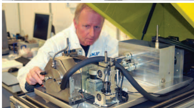
Научно-исследовательский центр SKF в Нидерландах